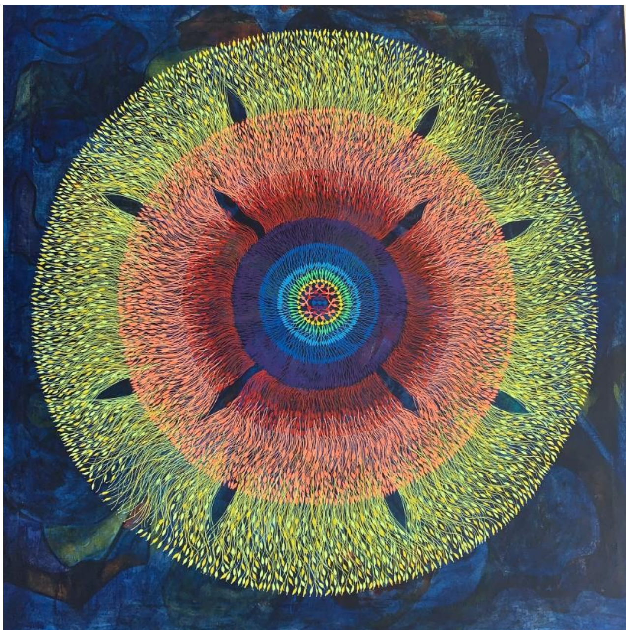
« La roue de la vie », œuvre de Célia Gouveiac Série des JE SUIS https://www.gouveiac.com/

Je suis ce que JE SUIS Je suis présence divine Je suis Amour Je suis Lumière Je suis énergie Je suis vibration Et je nage dans le mouvement de la vie