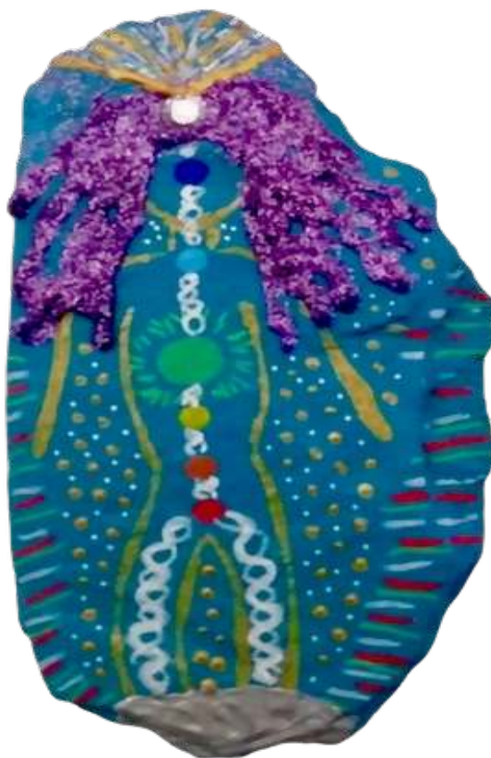
Galet vibratoire Lilith

Lien YouTube pour écouter la guidance : https://youtu.be/rLvXTYTz6Z8