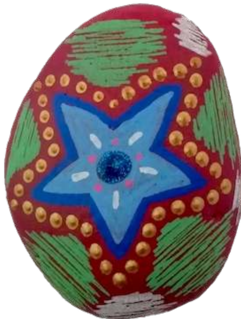
Galet vibratoire JE SUIS

Lien YouTube pour écouter la guidance : https://youtu.be/Wp_bsCmO4Tw