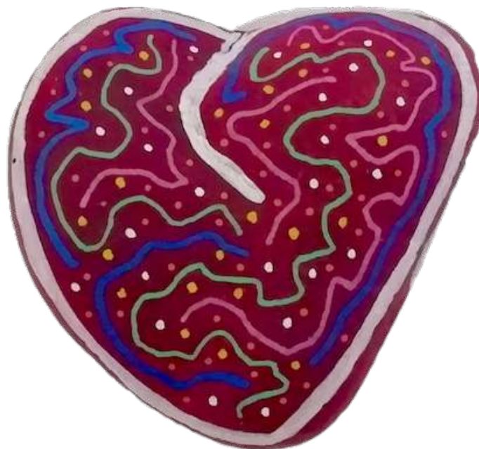
Galet vibratoire Agapé

À tous et toutes, grâce vous soit rendue !