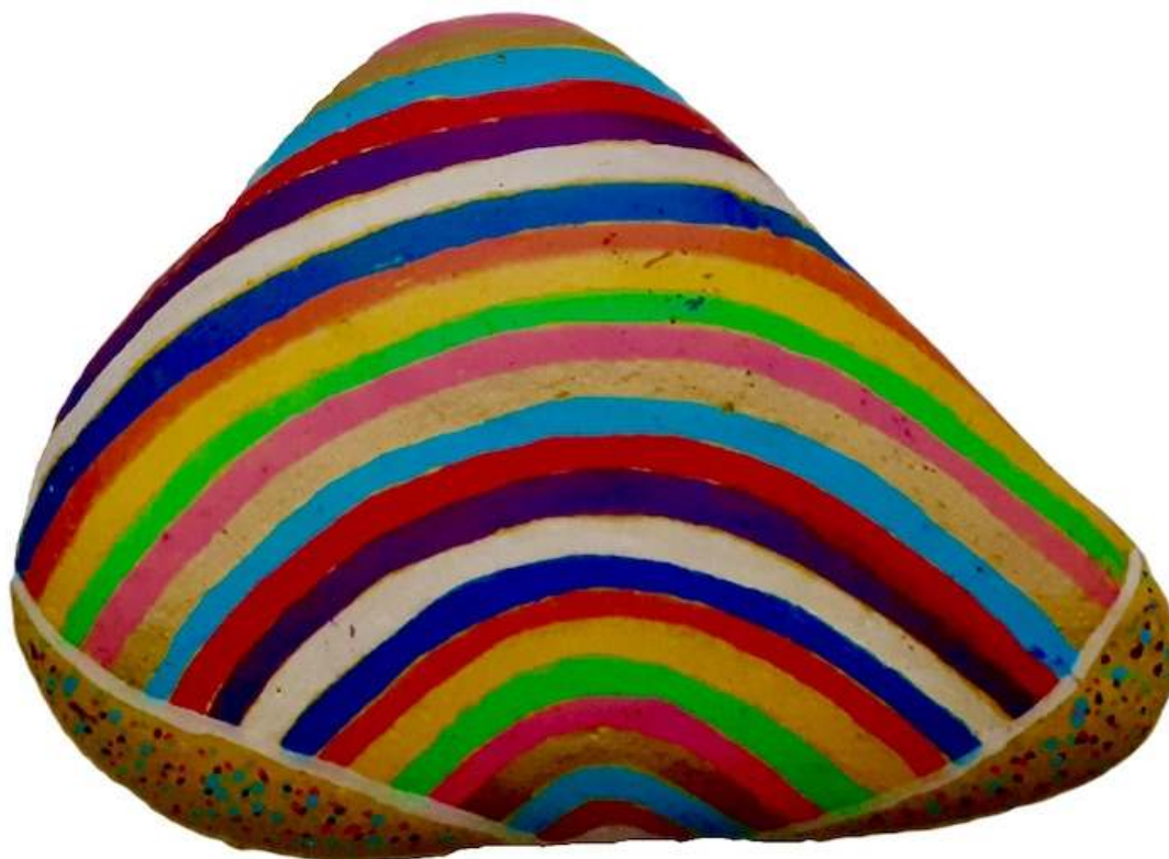
Galet vibratoire joie

Lien pour écouter la guidance : http://guidances.unite-jesuis.com/2019/06/28/audio-medmo-du-28-6-2019-14h30mn16/