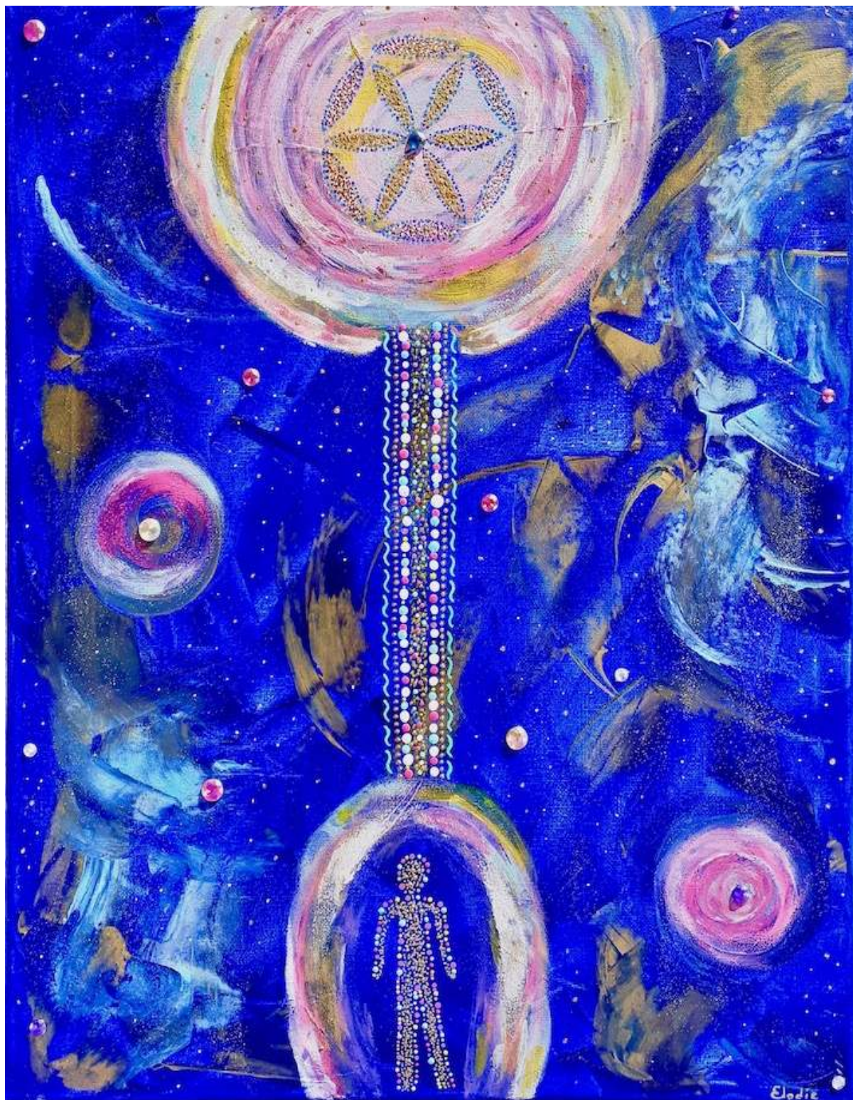
Je crée mon propre sillon

Lien pour écouter la guidance : http://guidances.unite-jesuis.com/2019/08/09/audio-medmo-du-9-8-2019-8h30mn21/