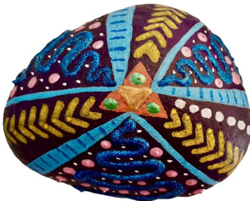
Galet vibratoire puissance

Lien pour écouter la guidance : http://guidances.unite-jesuis.com/2019/09/21/audio-medmo-du-21-9-2019-19h0mn22/