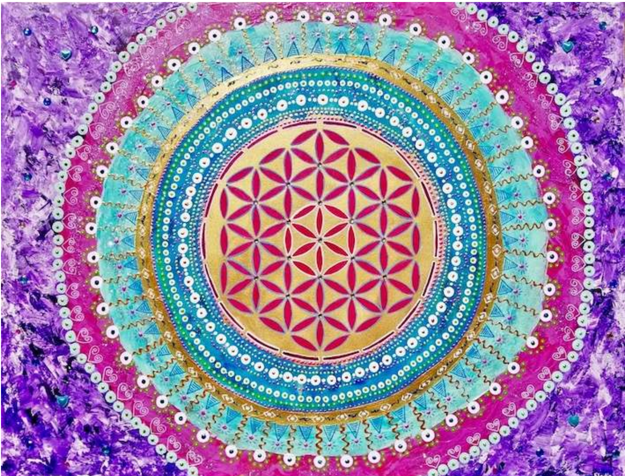
Je suis ce que je suis

Lien pour écouter la guidance : http://guidances.unite-jesuis.com/2019/07/31/audio-medmo-du-31-7-2019-8h30mn20/