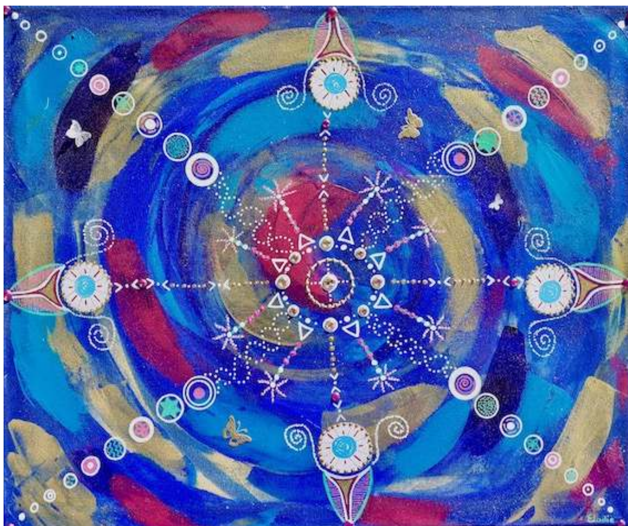
Le corps du Christ

Lien pour écouter la guidance : http://guidances.unite-jesuis.com/2019/08/10/audio-medmo-du-10-8-2019-8h30mn39/