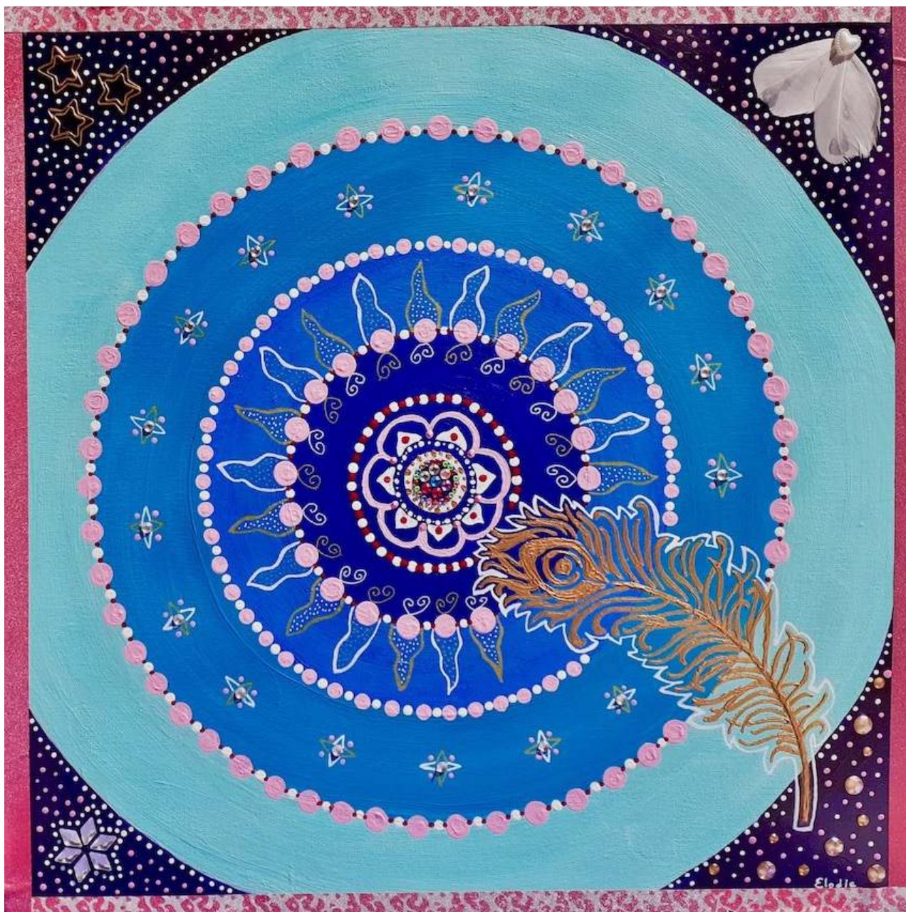
Conscience de la Terre

Lien YouTube (entre la minute 56 et 68) : https://youtu.be/WRyHx8yjFbw