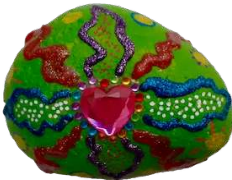
Galet vibratoire Christ

Lien YouTube pour écouter la guidance : https://youtu.be/LPSfizA35q8